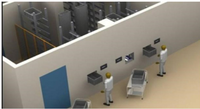
Den første spæde prototype på fremtidens sygehuslogistik blev i tirsdag vist frem i Arden.

Den første spæde prototype på fremtidens sygehuslogistik blev i tirsdag vist frem i Arden.